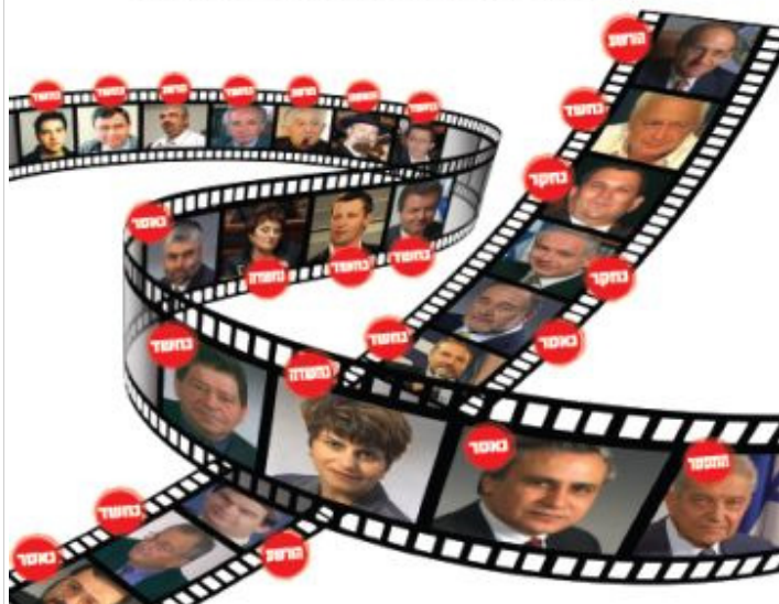
אומץ לב - 25 שנות מאבק בשחיתות השלטונית / מאת אריה אבנרי

שאגתו של האריה אבנרי נשמעת בכל הארץ ולא מעטים מתייראים מפניה, כי היא גם יודעת להיות נשכנית מאוד - את המנגינה הזאת שאבנרי מנצח עליה שנים רבות אסור להפסיק לנגן. חשוב אפילו להגביר את עוצמתה - סקירה לספרו החדש - "אומץ לב"